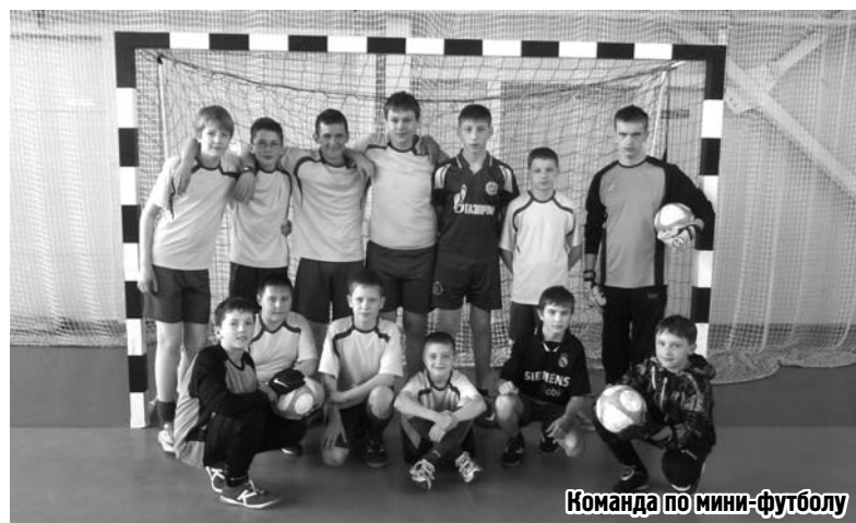
Команда по мини-футболу

Ликвидация стихийных свалок. В 2012 году на вывоз несанкционированных свалок было потрачено 283 тыс.рублей. Жители часто размещают свой бытовой мусор на окраинах деревень, у берегов реки Ижоры, и мы вынуждены направлять существенные суммы на уборку му-